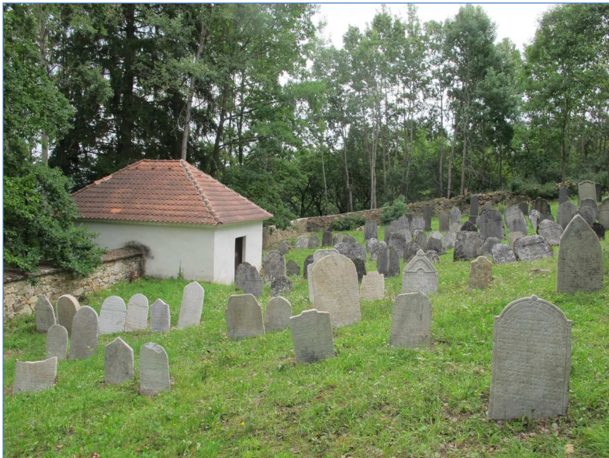
hřbitov v Čichticích vyčištěný od nežádoucí zeleně a připravený na fotografování

Je nutno zdůraznit, že nedílnou součástí jsou i přípravné práce tzn. úprava zeleně na hřbitově (seč trávy, ořez stromů a keřů), očištění náhrobků od vegetace a samotné dočištění epitafů. Mnohdy je potřeba náhrobky vyzvednout ze země, otočit, pokud jsou spadlé textem k zemi.