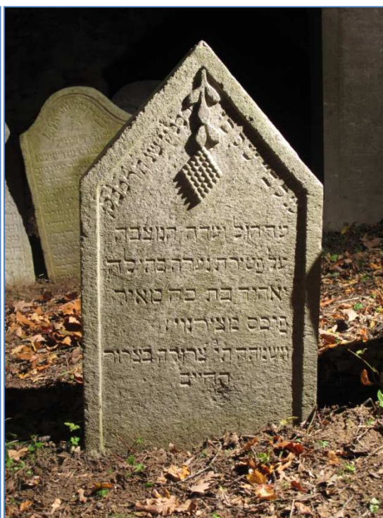
náhrobek č. 58