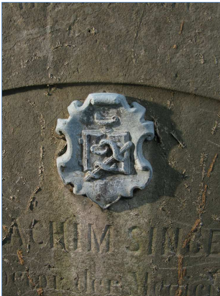
detail symbolu na náhrobku č. 31 na hřbitově ve Volyni